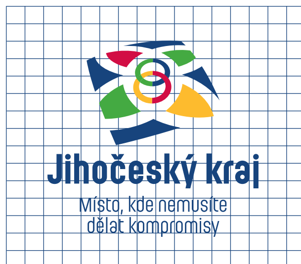
rozkres značky v konstrukční síti (5 x 5 mm).

Ochranná zóna značky je minimální velikost pole, do něhož nesmí zasahovat žádné grafické prvky – například texty, fotografie, ilustrace, další značky atd. Velikost ochranné zóny se rovná 2 x.