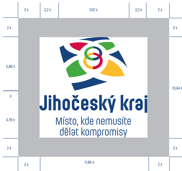
proporční schéma značky ochranná zóna značky

Velikosti a proporce jednotlivých prvků základního provedení značky jsou kodifikovány jednotkou x, která se rovná mezerou mezi symbolem a logotypem.